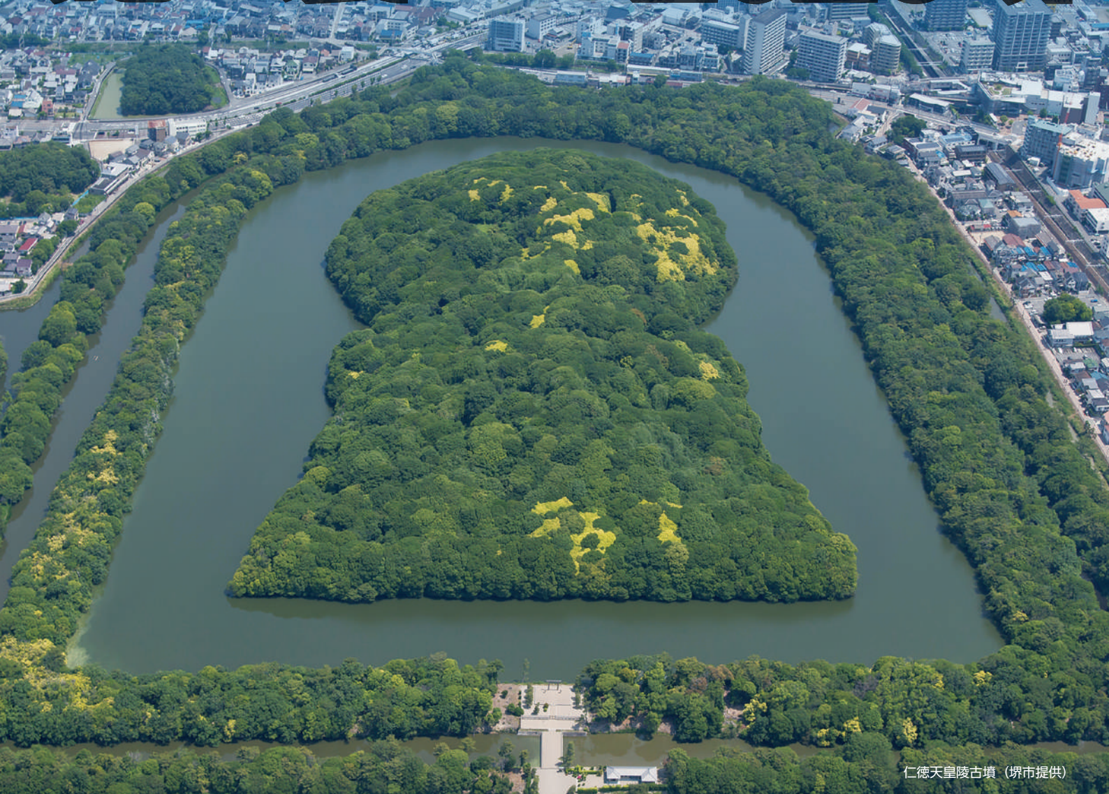
仁徳天皇陵古墳