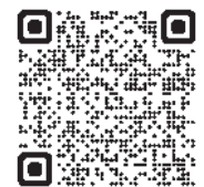
施工展ホームページ