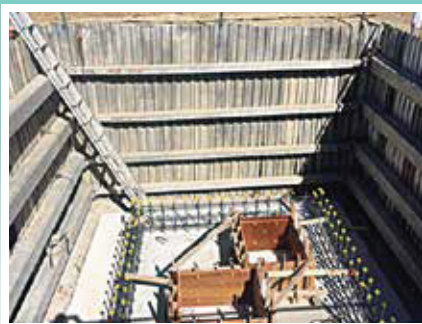
配水管不断水バルブ設置工事