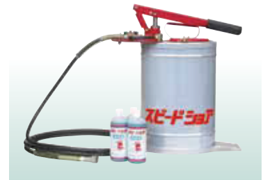
添加液・水圧ポンプ