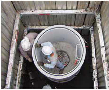
下水道マンホール設置工事