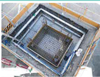
歩道橋エレベータ基礎工事