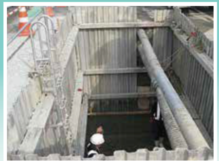
電線共同溝設置工事