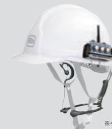
※ヘルメットは付属しません。