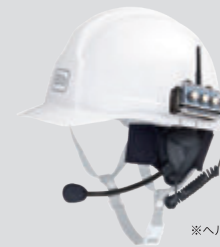
※ヘルメットは付属しません。