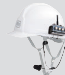
※ヘルメットは付属しません。