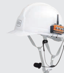
※ヘルメットは付属しません。