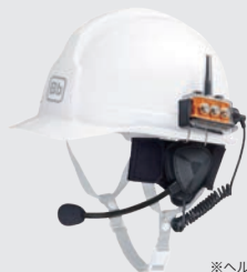
※ヘルメットは付属しません。