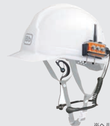
※ヘルメットは付属しません。