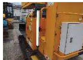
機械に取り付けて！