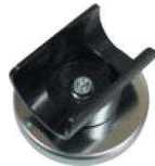
マグネットクリップ